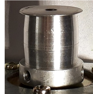
Vue pour modèle