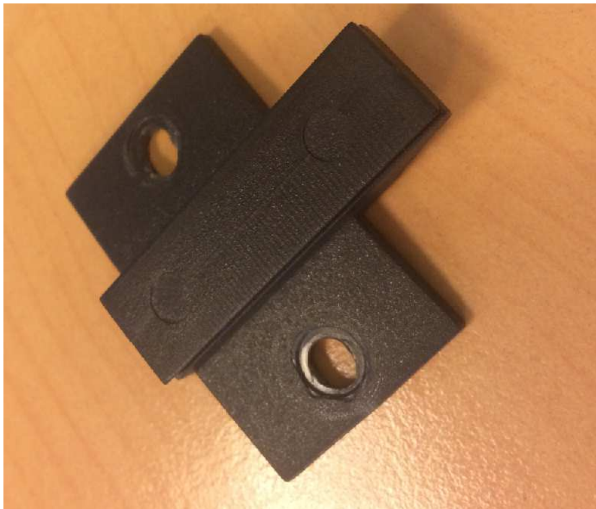
Vue du dessus de l'existant

Je vous sollicite donc pour la fabrication d'une pièce métallique qui me servirait d'adaptateur pour utiliser un chercheur optique (une telle pièce existe déjà, mais uniquement en plastique et ça ne tiendra pas le poids, de plus, elle n'est pas plate)