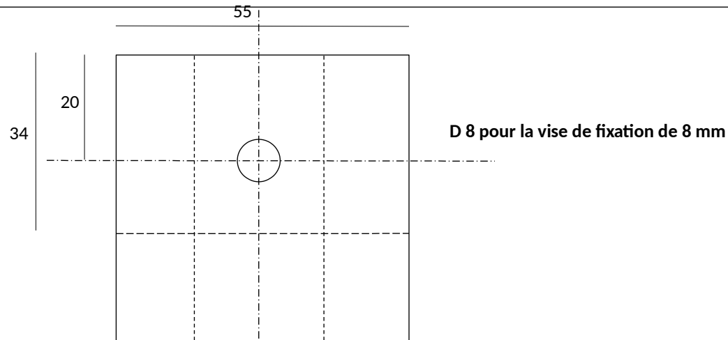
Vue de dessus

D35 ajust é pour coulisser le guide et le centreur de 35 mm précis